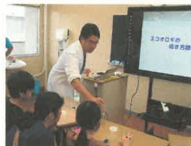
WS④ 触ってみよう!コオロギの翅とかたちと昆虫の変態