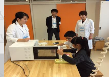
電子レンジで実験しよう