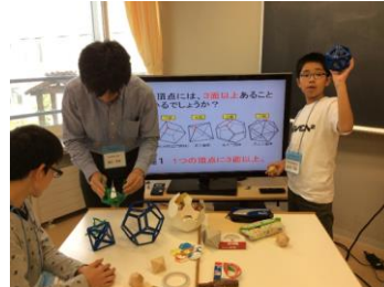
正多面体を作ろう