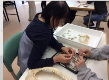
化石や石に触れてみよう